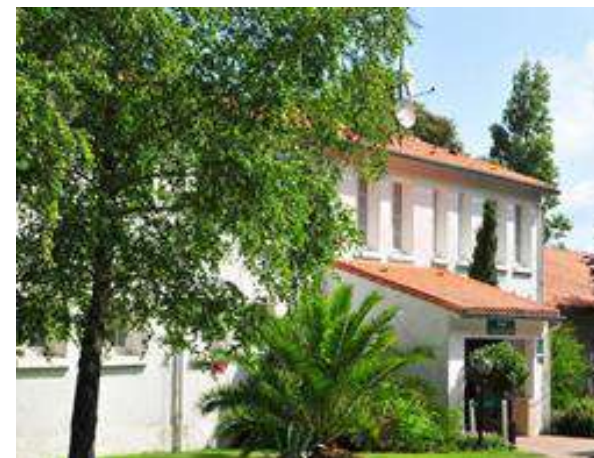
Dans le Centre des Quatre Vents