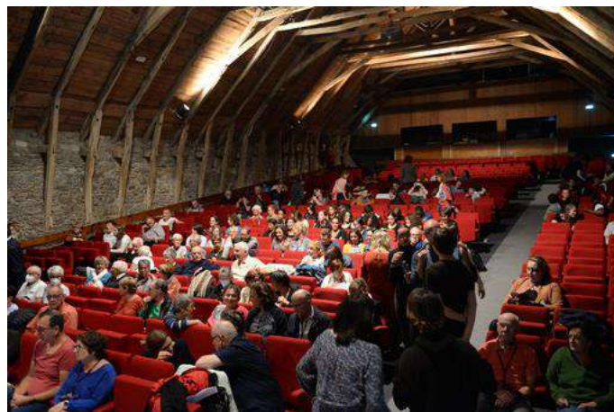
Dans la salle des Salorges

Ils étaient, là, plus de 200, de 12 à 84 ans : des collégiens, des lycéens, des enseignants, des comédiens, des parents des 5 départements des Pays de la Loire, invités 40 ans plus tard par COMETE 44, En Jeu 49, AMLET 53, TPA 72 et Vents et Marées 85.