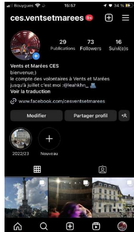
Compte des volontaires de Vents et Marées