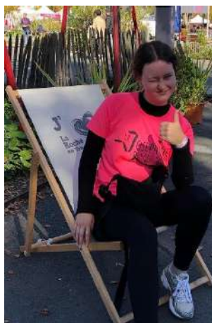
La Joséphine en octobre