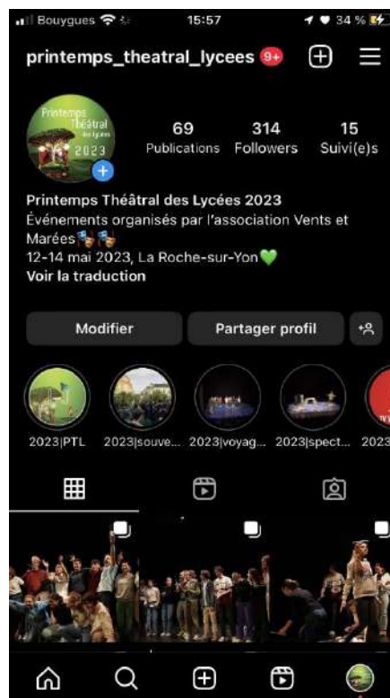
Compte du Printemps des lycées