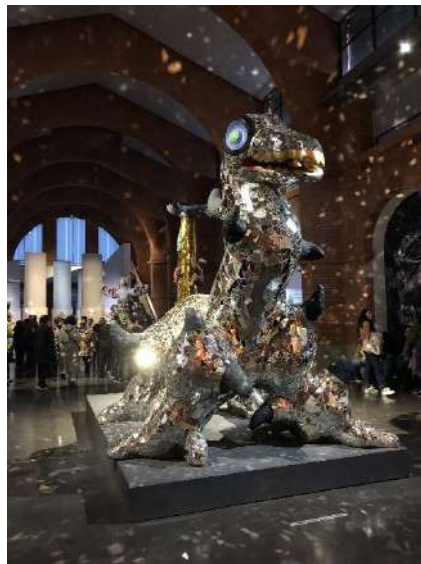
Musée « Les Abattoirs » à Toulouse, exposition dédiée à Nikki de Saint Phalle