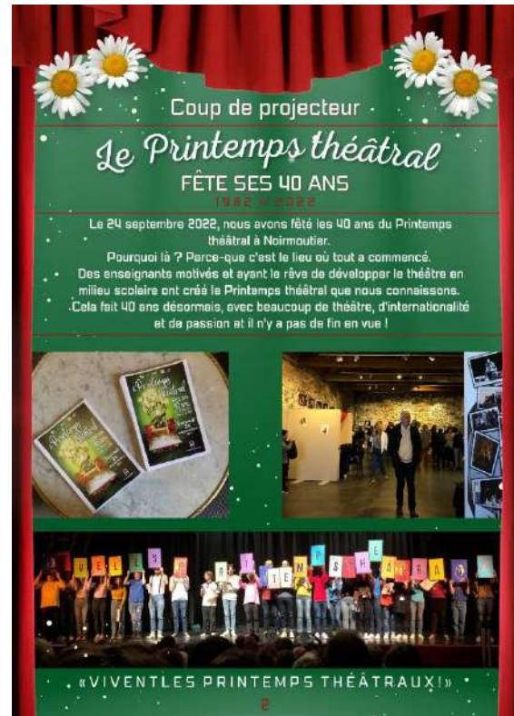
Newsletter du 40 ans du Printemps Théâtral avec des interviews

- a géré le compte Instagram des volontaires du Vents et Marées avec des textes et des photos hebdomadaires de son séjour