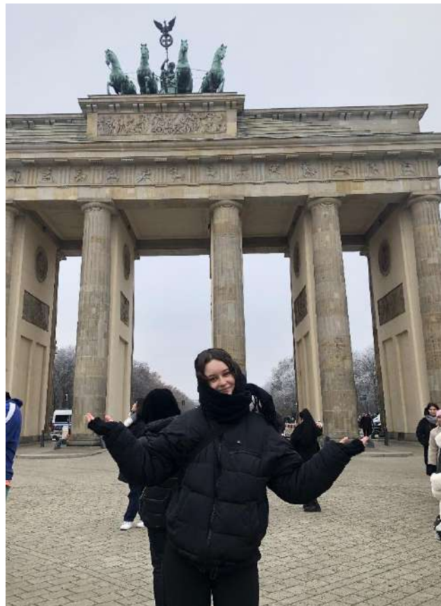
Brandenburger Tor, Berlin en décembre