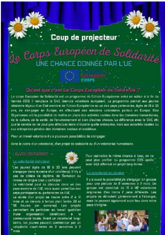
Newsletter du Corps Européen de Solidarité