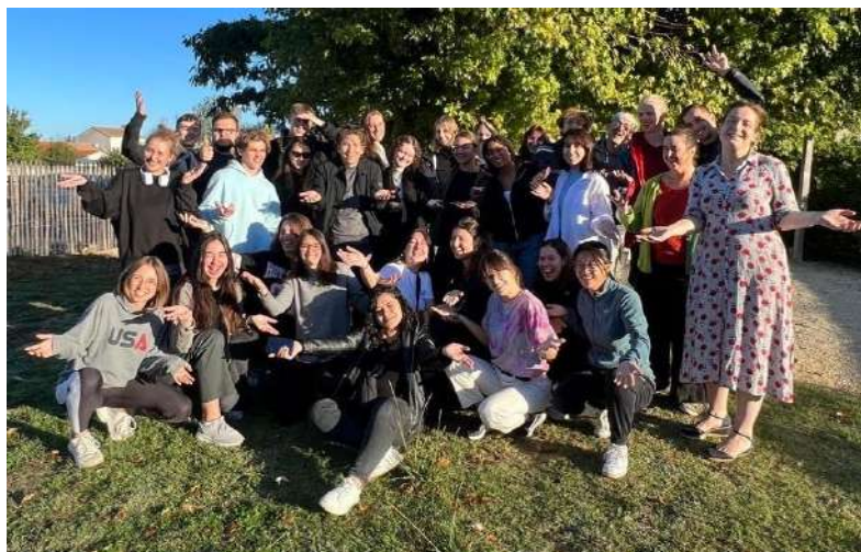
Séminaire d'accueil à Saint-Jean-de-Monts

-a participé à deux séminaires (Saint-Jean-de-Monts, Narbonne) avec des jeunes volontaires internationaux en France