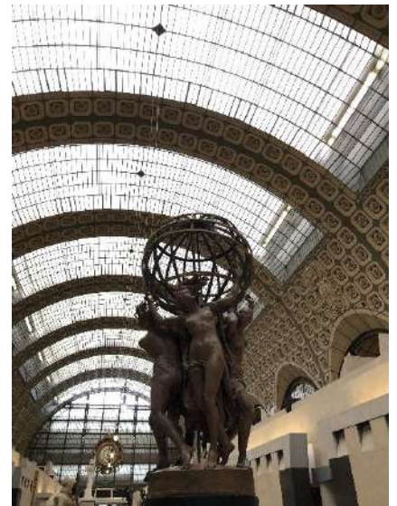
Musée d'Orsay à Paris