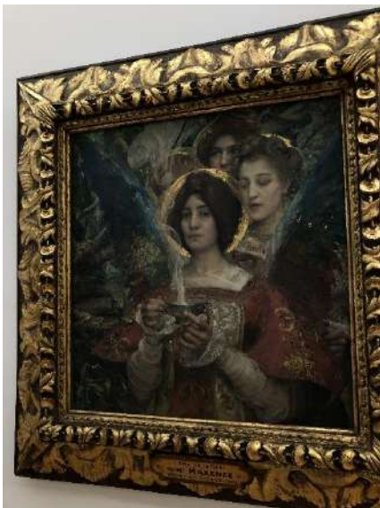
« L'âme de la forêt » d'Edgard Maxence à Nantes

De plus, elle a visité beaucoup de musées dans des villes différentes en France. Son tableau préféré « L'âme de la forêt » se trouve dans le musée d'art à Nantes.