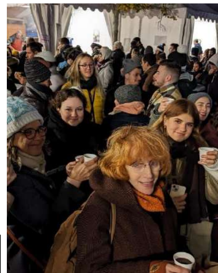
Marché du Noël au Beaulieu-sous-la-Roche