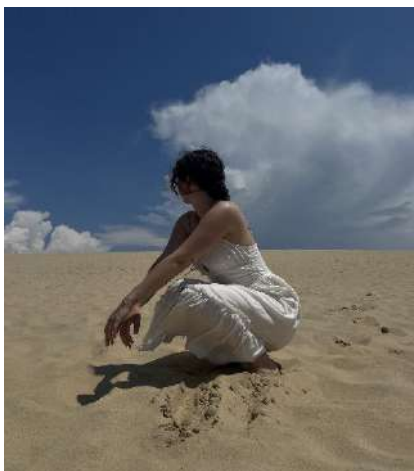
La Dune du Pilat, 1h de Bordeaux