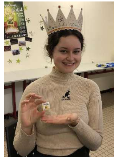
La reine et sa première fève