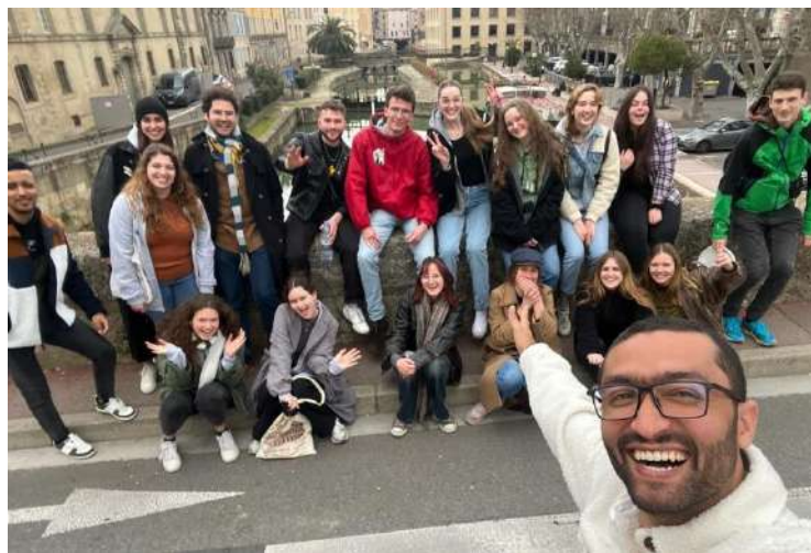
Séminaire mi-parcours à Narbonne

-a reçu un aperçu dans la démarche d'un événement en accompagnant l'équipe de Uents et Marées à des rendez-vous d'organisation (Conférence de presse, C.A., Grand R, CREPS)