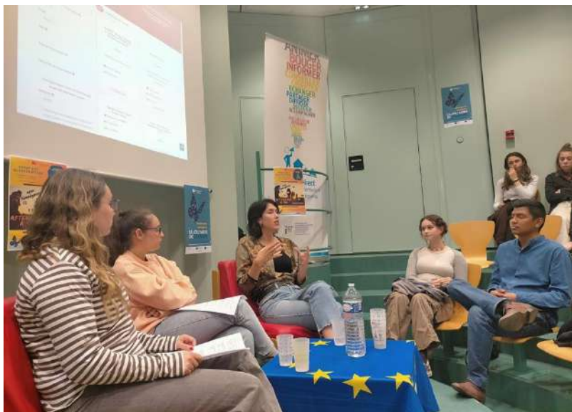
Forum des Globetrotters à la médiathèque pendant le mois de l'Europe

- a témoigné son expérience avec le Corps Européen de Solidarité dans le cadre des Erasmus Days et du mois de l'Europe 7 fois