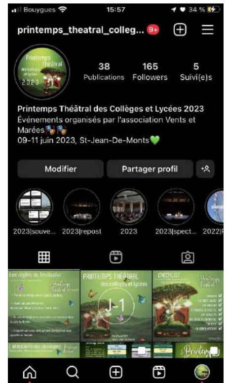
Compte du Printemps des collèges